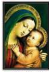
26- N.ª S.ª Madre del Buen Consejo