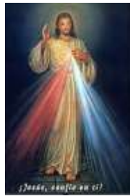
12. Divina Misericordia