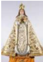
25- N.ª S.ª de la Cabeza