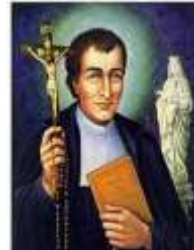
28-S. Luis María Grignon de Monfort