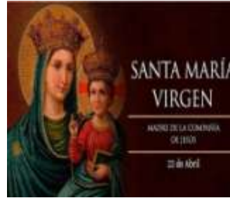
22- S.ª M.ª Virgen Madre de la Compañía de Jesús