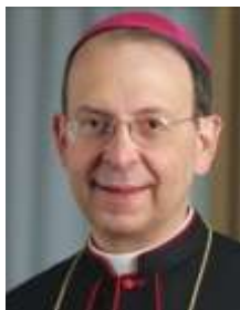
ARZOBISPO WILLIAM E. LORI