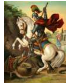
23- S. Jorge