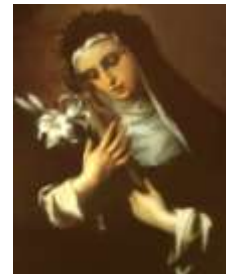
29-Sta. Catalina de Siena