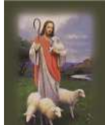
26- Buen Pastor