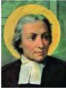
07- S. Juan Bautista de La Salle